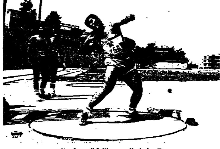
عسان ناس يرمي الكرة الحديدية